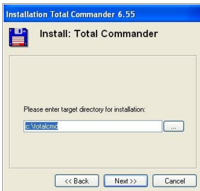
Rysunek 2. Ścieżka do instalacji programu.

W kolejnym kroku instalator zapyta nas gdzie chcemy zainstalować program. Domyślnie jest to c:\totalcmd. Po wybraniu ścieżki instalacji programu klikamy w następnych krokach na „Next”. Po zakończeniu instalacji program jest gotowy do użycia.